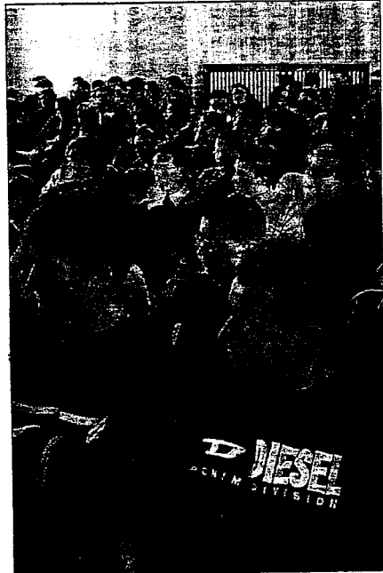
Gli studenti del «Cangrande» durante l'assemblea (Amato)

ospedali, la Procura della Repubblica, ma anche fonti del singolo giornalista. In ogni caso queste fonti vanno verificate ed eventualmente integrate, per informare nella maniera più corretta e completa possibile».