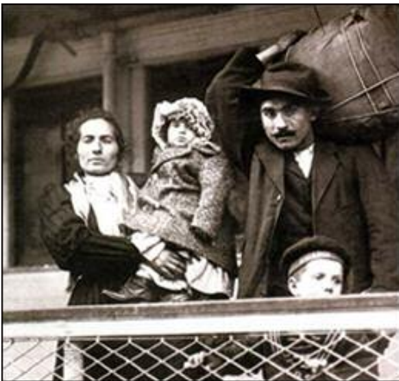
immigrazione italiana in Canada

Non è affatto vero,quindi,che attribuendo il diritto al vo-to agli immigrati si migliora e favorisce la loro integrazio-